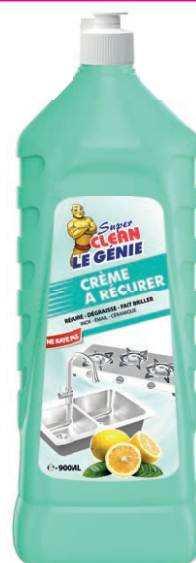
CRÈME À RÉCURER CITRON

La crème à récurer SUPER CLEAN élimine les taches les plus tenaces sans abîmer les surfaces. Grâce à sa formule puissante, elle nettoie, dégraisse, récurer et fait briller toute la maison : évier, robinetterie, douches, inox, émail et céramique. Son parfum citronné laisse une agréable odeur de fraîcheur et de propreté.